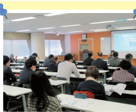
昨年のセミナーの様子