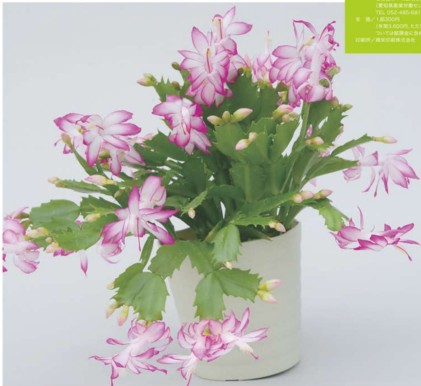
今月のあいちの花：シャコバサボテン

発行 / 愛知県中小企業団体中央会 〒450-0002 名古屋市中村区名駅4-4-38 (愛知県産業労働センター) TEL 052-485-6811 定価 / 1部300円 (年間3,600円、ただし会員に ついては賦課金を含めて徴収) 印刷所 / 興栄印刷株式会社