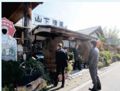
放浪美術館見学の様子