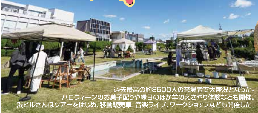
過去最高の約8500人の来場者で大盛況となった。 ハロウィーンのお菓子作りや縁日のほか羊のえさやり体験なども開催。 渋ビルさんぽツアーをはじめ、移動販売車、音楽ライブ、ワークショップなども開催した。