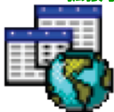
iqy ファイルのアイコン